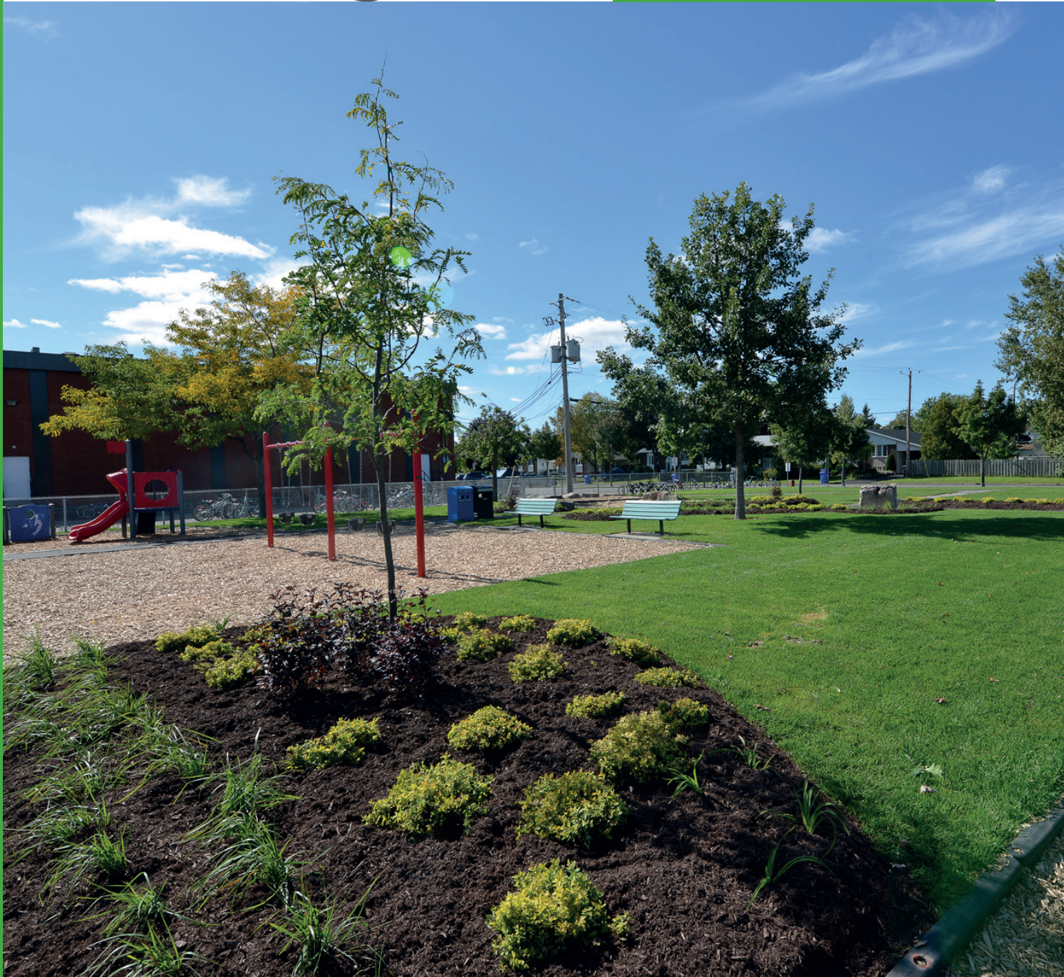
Parc Yves Saint-Arneault

BULLETIN D'INFORMATION Volume 42, numéro 2 Été 2021