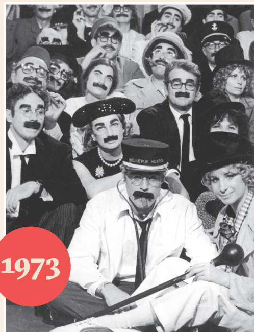
Nos plus belles années (The Way We Were) Sydney Pollack

Réponse : 1) Echos Vedettes, 7 jours, Photo Journal (1937-1978)