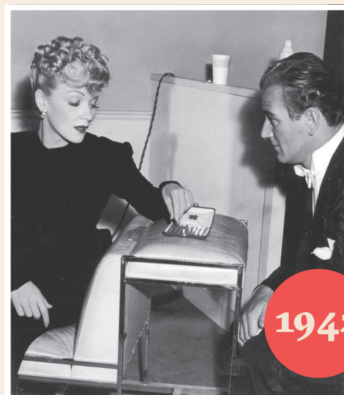
La fièvre de l'or noir Marlene Dietrich et John Wayne