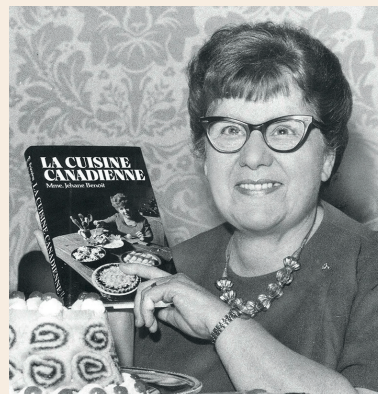
Jehane Benoit