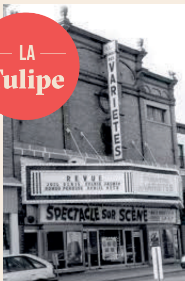
L'édifice du Théâtre des Variétés

Gilles Latulippe a perpétué la tradition du burlesque en transformant le théâtre Dominion (sis au 4530, rue Papineau) et en ouvrant en lieu et place le Théâtre des Variétés en septembre 1967, une salle de spectacle très fréquentée à Montréal. Il en a assuré la direction pendant 33 ans jusqu'à sa fermeture en 2000 après plus de 7000 représentations.