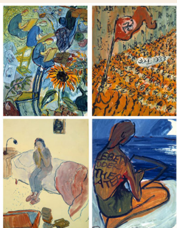
Dessins extraits de Vie? Ou Théâtre ?

« Cette fiction s'inspire de la vie de Charlotte Salomon (1917-1943), peintre allemande, morte à vingt-six ans, enceinte, dans un camp, à Auschwitz. À l'âge de 23 ans, lorsqu'elle apprend la vérité sur le suicide de sa tante et sa mère, elle se réfugie dans la peinture et compose en deux ans une œuvre intitulée : Leben oder Theater, la Vie ou le Théâtre ? Une sorte de roman autobiographique en images, composé de gouaches et textes peints, accompagné d'indications musicales. En 1943, Charlotte Salomon, exilée dans le sud de la France, est dénoncée et arrêtée. Son œuvre, qu'elle avait confiée à son médecin, en lui disant