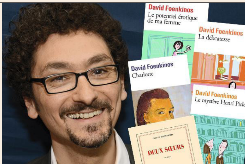
David Foenkinos en cinq livres