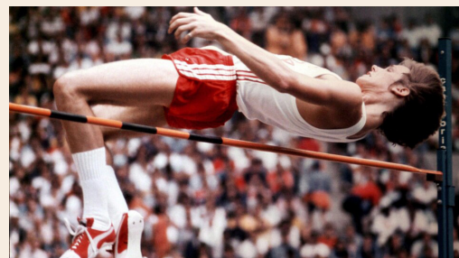
Greg Joy, médaillé d'argent au saut en hauteur, le héros canadien des Jeux

Réponses : 1) 2.23 mètres 2) Un castor, baptisé Amik 3) Richard Garneau