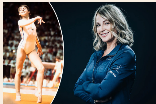
Nadia Comaneci