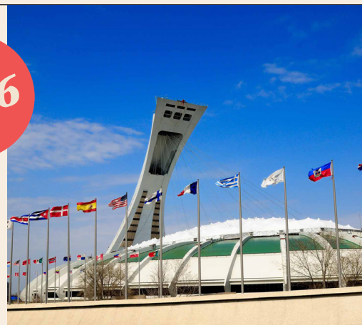
Le Stade olympique de Montréal, hôte des jeux de 1976