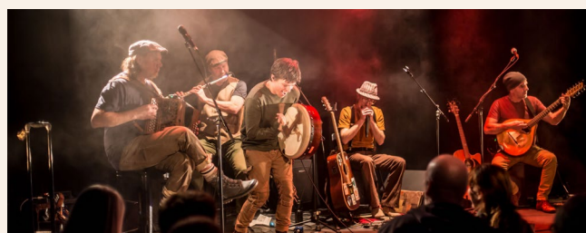
Les Tireux d'Roche

Réponse: (1) Un « tapoux de pieds » qui utilise une technique de percussion de la musique traditionnelle québécoise qui consiste à produire un son en tapant ses pieds contre le sol contre une planche (2) Un « reel »