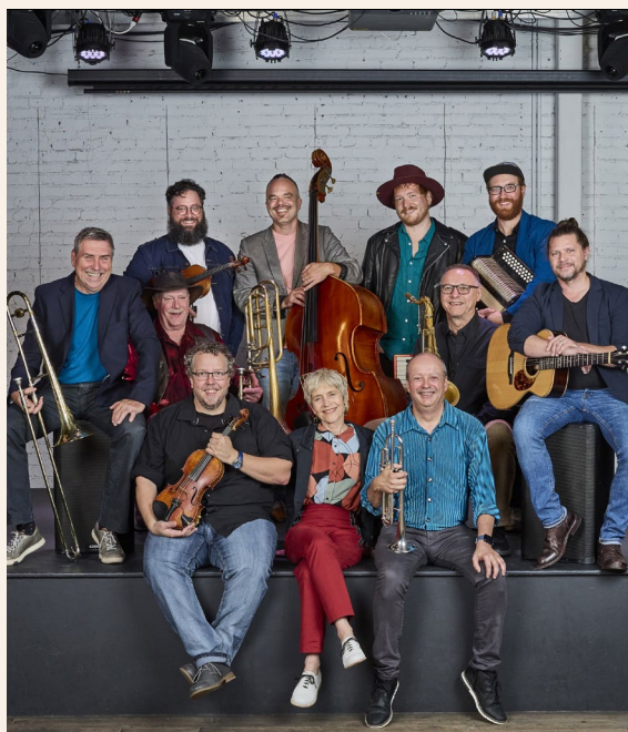
La Bottine Souriante