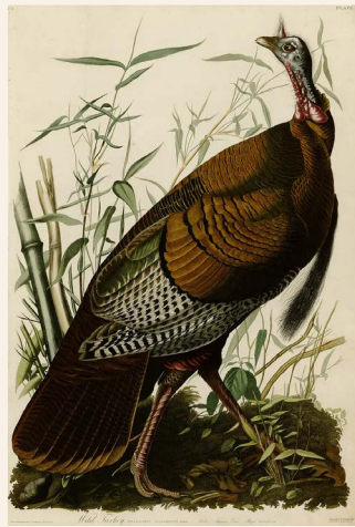
La planche n°1 de The Birds of America par Audubon