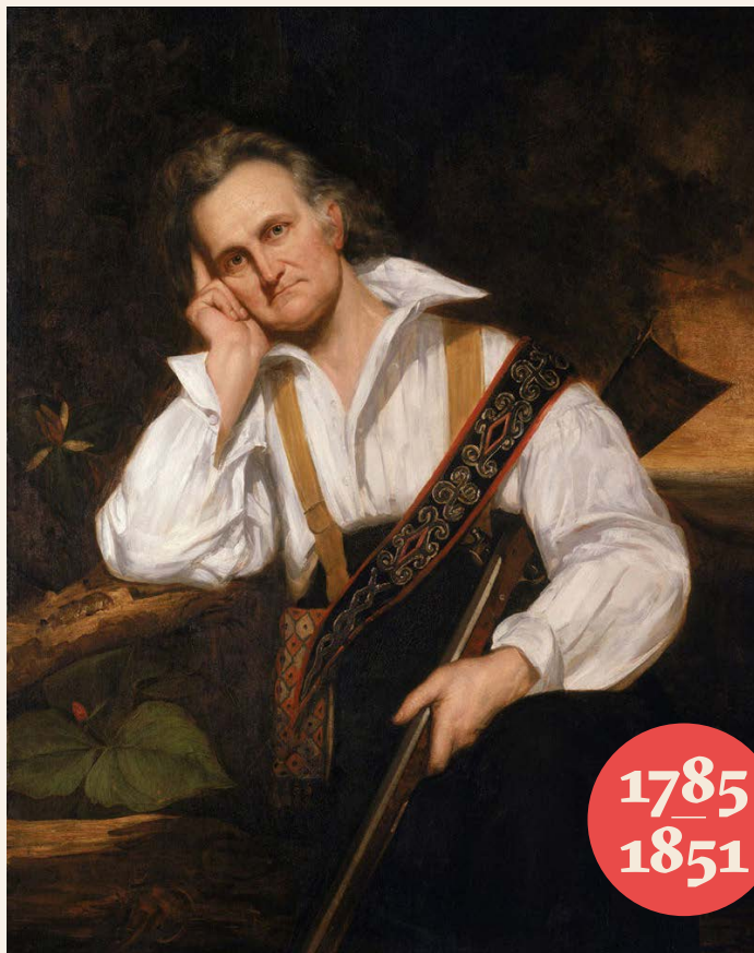
John James Audubon

UNE INITIATIVE DE LA BIBLIOTHÈQUE MUNICIPALE DE SAINTE-JULIE