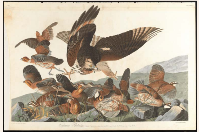
Colin de Virginie ( colinus virginianus ) et buse à épaulette ( buteo lineatus ), Birds of America (Les Oiseaux d'Amérique) - paradisperdus.hypotheses.org

« Un véritable défenseur de l'environnement est quelqu'un qui sait qu'il n'hérite pas la terre de ses parents, mais l'emprunte à ses enfants. »