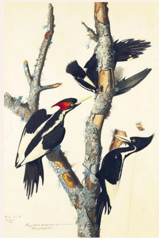
Pic à bec ivoire ( Campephilus principalis )