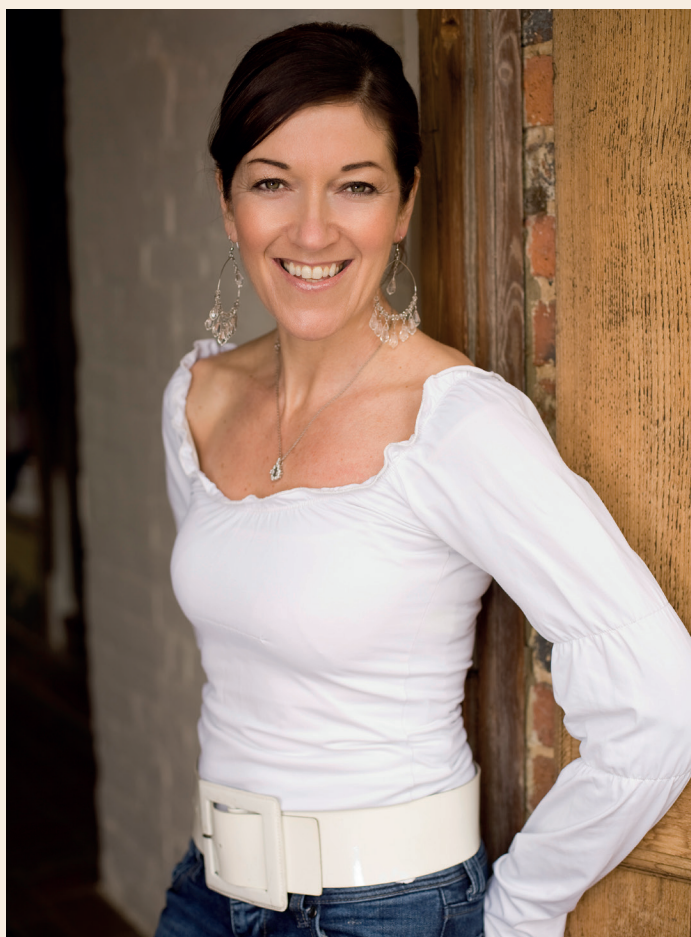
Victoria Hislop

Source : https://fr.wikipedia.org/wiki/Victoria_Hislop , consulté le 10 mars 2021.