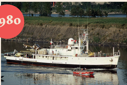
Son navire, la Calypso, à Montréal