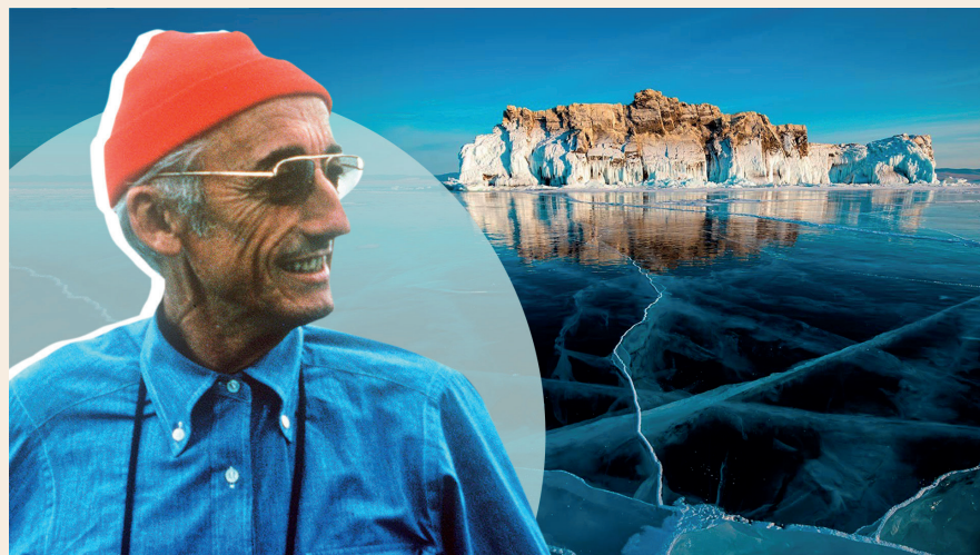
Jacques Cousteau et son emblématique bonnet rouge