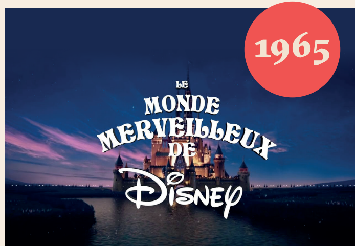
Le monde merveilleux de Disney - Source : youtube.com

Réponse : 1) 1224 de 1954 au 14 octobre 2020. 2) En 1928. 3) Blanche-Neige et les sept nains en 1937.