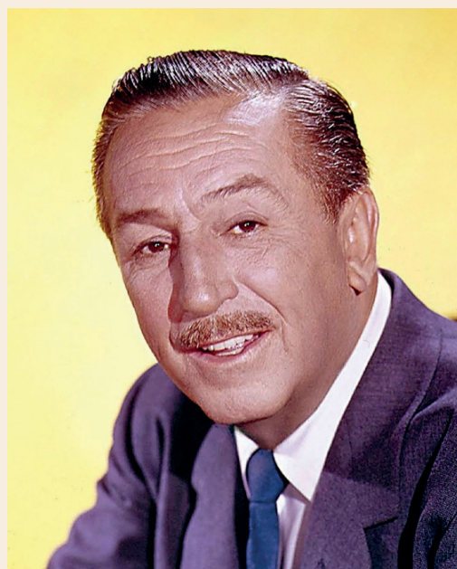
Walt Disney 1901-1966