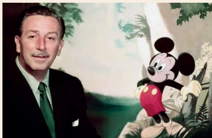
Walt Disney et Mickey Mouse