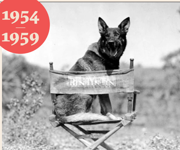
Rintintin (série télévisée)