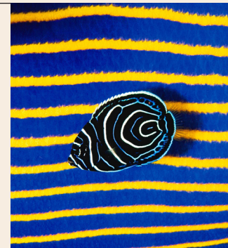
Ange de mer impérial (juvénile)