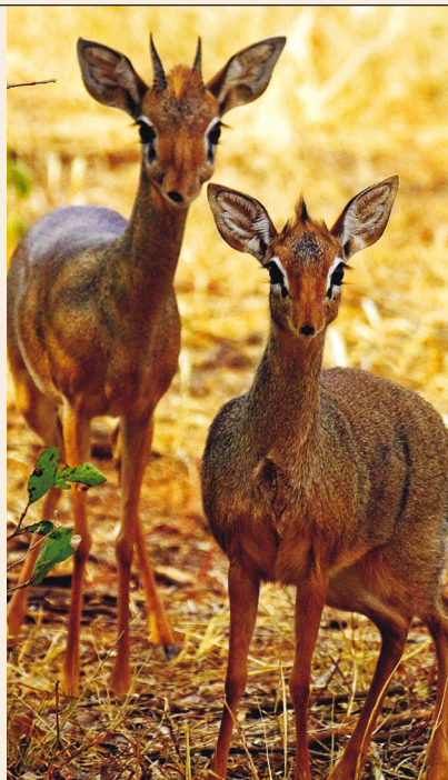
Dik-dik de Kirk de la famille des bovidés

Extrait: https://www.ledevoir.com/lire/591769/fauna-un-fascinant-voyage-au-coeur-du-monde-animal , consulté le 25 octobre 2022