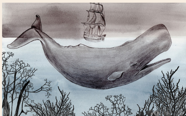
Moby Dick – Herman Melville, 1851

Les animaux du cinéma , https://www.lesanimauxducinema.fr/