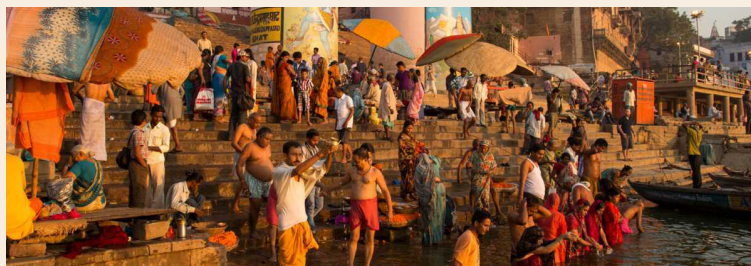
Le Gange, fleuve sacré

Que voir en Inde ? Partir.com 2020, 4 min 49 s https://bit.ly/3FjHmy6