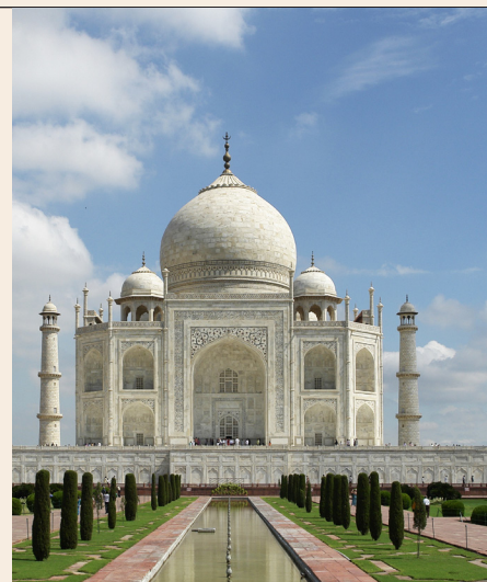
Taj Mahal, Inde