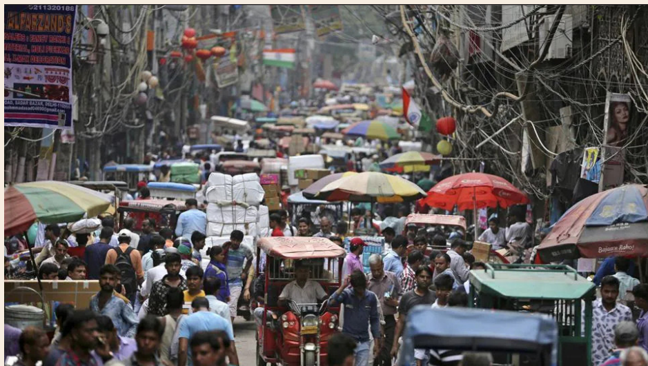
New Delhi, capitale de l'Inde – Source : hindustantimes.com

UNE INITIATIVE DE LA BIBLIOTHÈQUE MUNICIPALE DE SAINTE-JULIE