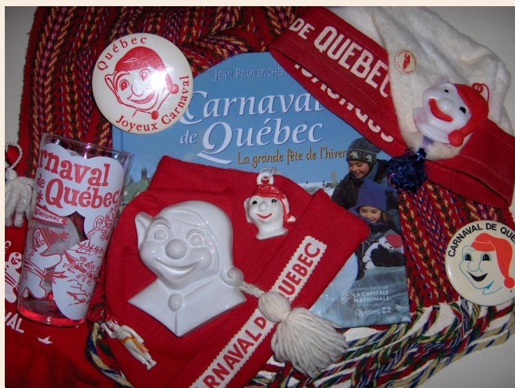
Macarons, épinglettes et effigies sur tuque et ceinture fléchée

« Les Québécois chialent beaucoup contre l'hiver, mais ils aiment aussi s'amuser ; le Carnaval est là pour les réconcilier dans leur dualité », Jean Provencher, écrivain